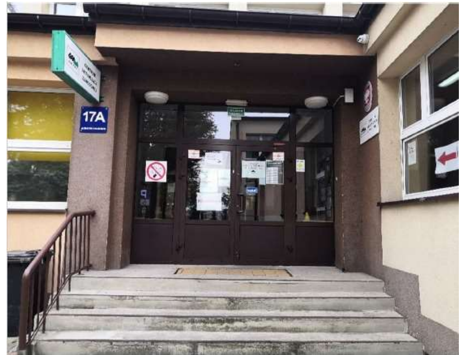
Wyjście z budynku od strony starostwa

Osoby zgłaszające się na osobistą wizytę wchodzą do budynku od ul. Krasickiego, natomiast osoby opuszczające urząd korzystają z wyjścia od strony starostwa. Prosimy o stosowanie się do widocznych na terenie budynku oznaczeń.