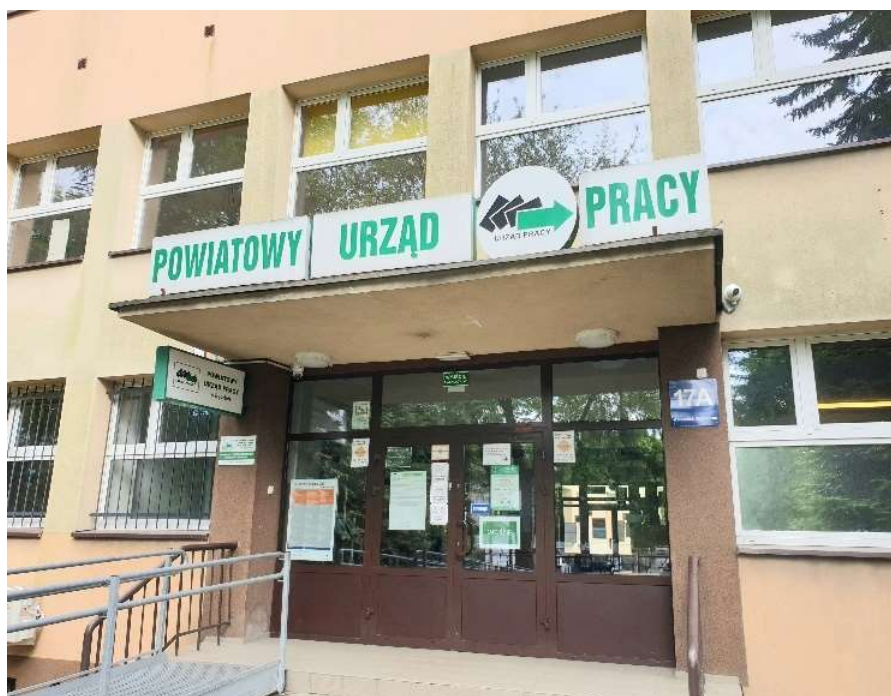
Wejście do budynku od ul. Krasickiego

Obsługa spraw prowadzona jest aktualnie na stanowiskach pracy w pokojach z wykorzystaniem systemu kolejkowego (nie tak jak dotychczas przy stanowiskach tymczasowych, znajdujących się przy wejściach i wyjściach do budynku).