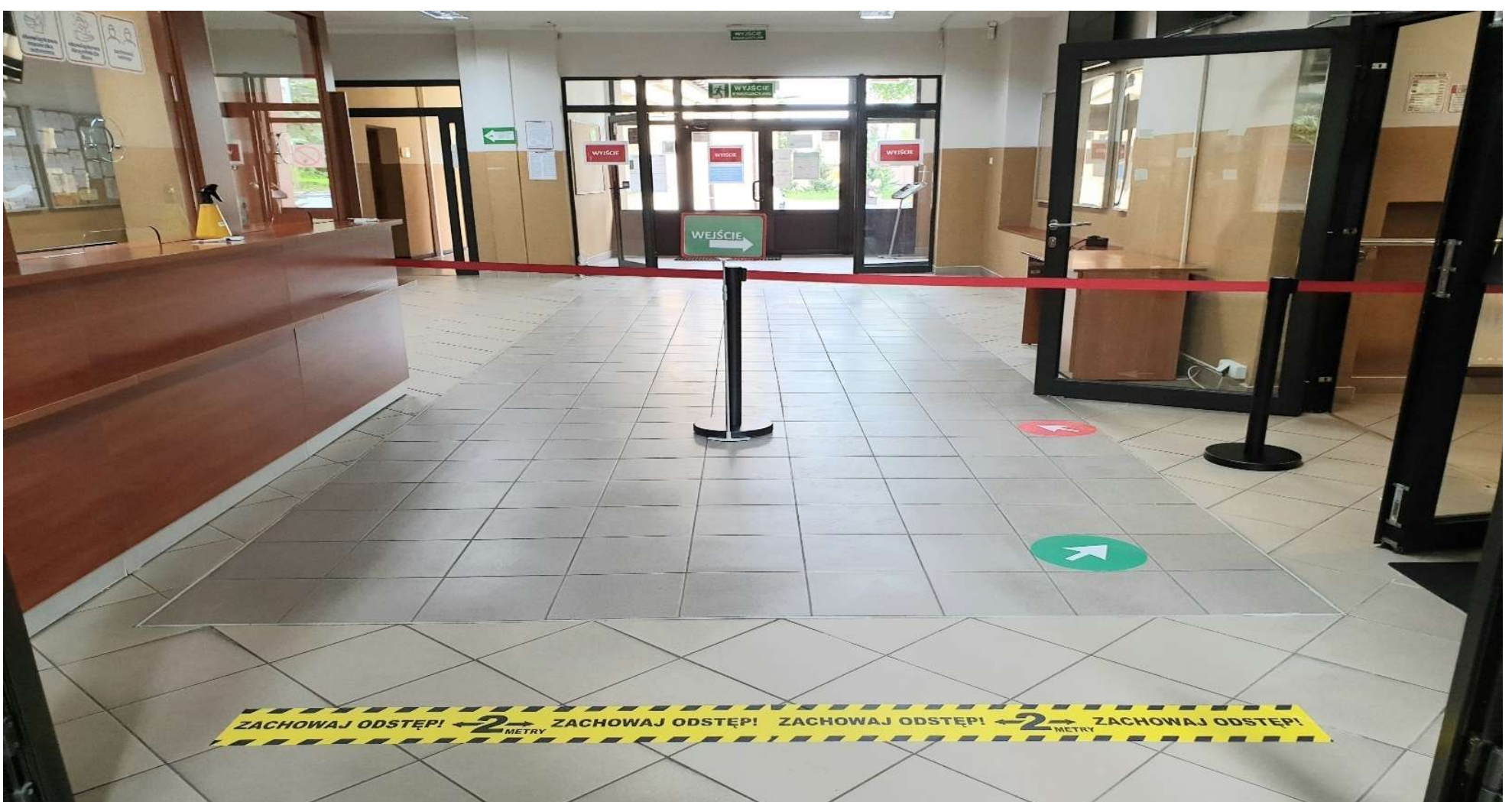
Prosimy o stosowanie się do widocznych oznaczeń